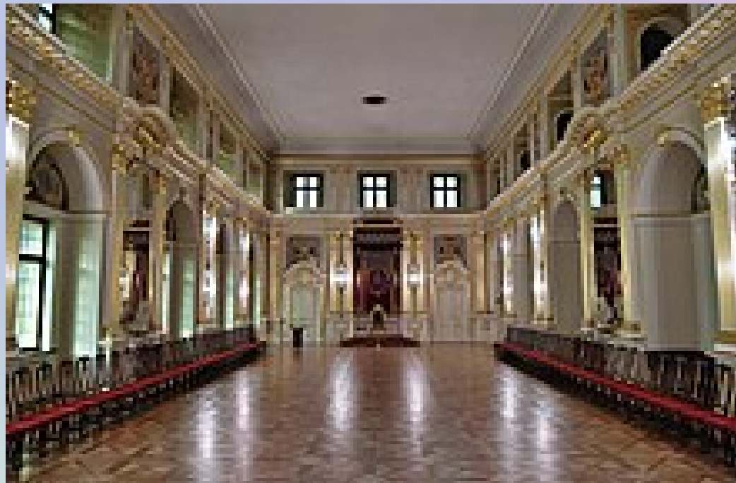
Zamek Królewski w Warszawie, Sala Senatorska (2016)

W dniu ustanowienia Konstytucji 3 maja przestaje istnieć Rzeczypospolita Obojga Narodów, a w jej miejsce zostaje powołana Rzeczypospolita Polska.