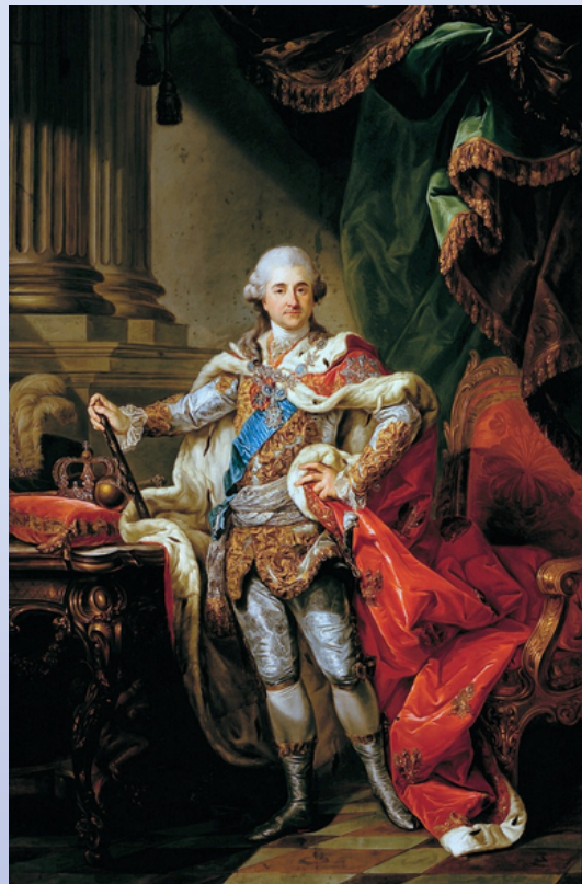
Stanisław August Poniatowski

ostatni król Polski (panujący w latach 1764 – 1795)