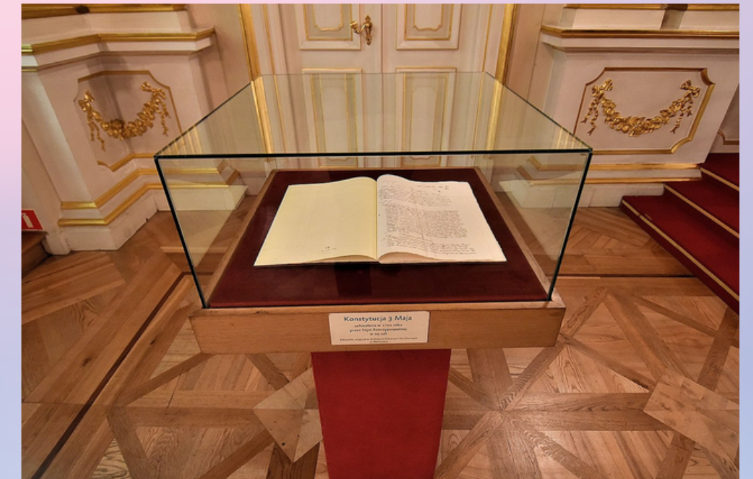
Kopia Konstytucji 3 maja eksponowana w Sali Senatorskiej