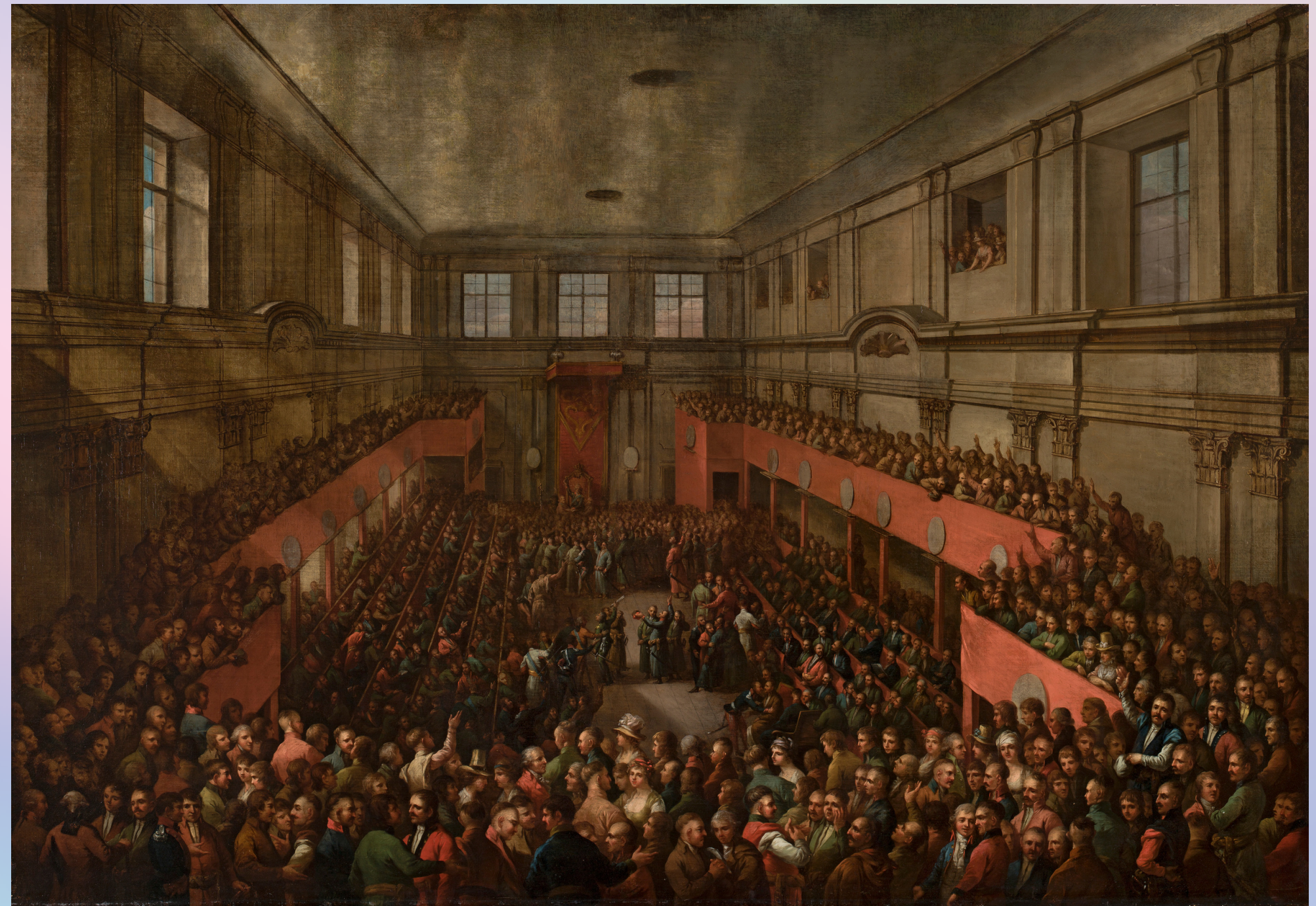
Kazimierz Wojniakowski, Uchwalenie Konstytucji 3 maja

Głównym dziełem Sejmu Wielkiego było jednak uchwalenie Konstytucji 3 maja w 1791 roku