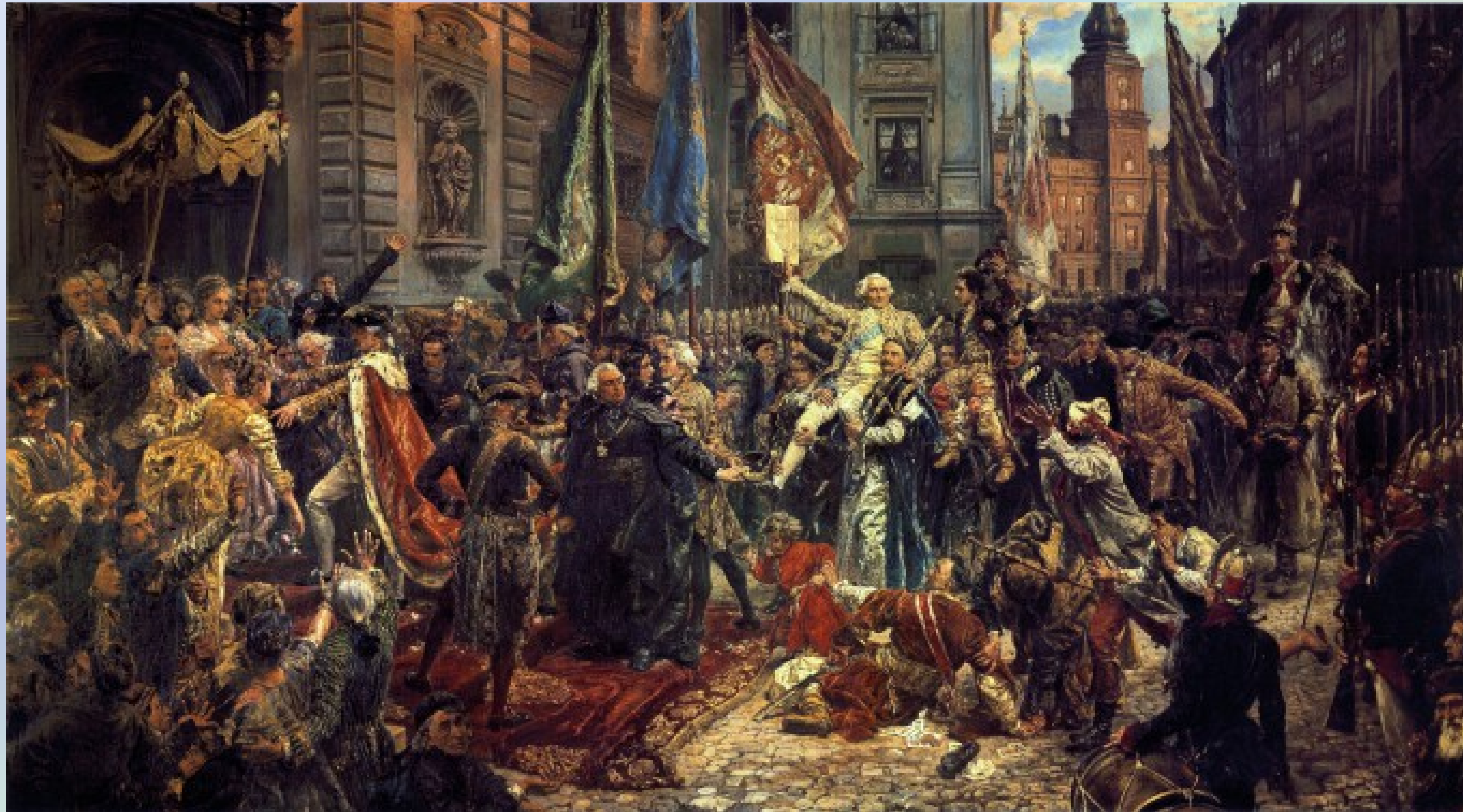
Jan Matejko Konstytucja 3 maja 1791 roku