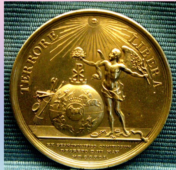
Medal wybity w 1791 z okazji uchwalenia Konstytucji 3 maja