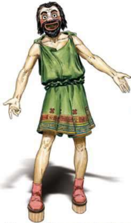
Aktor w męskiej masce komicznej