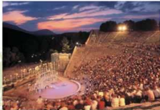
Teatr w Epidauros – wygląd współczesny