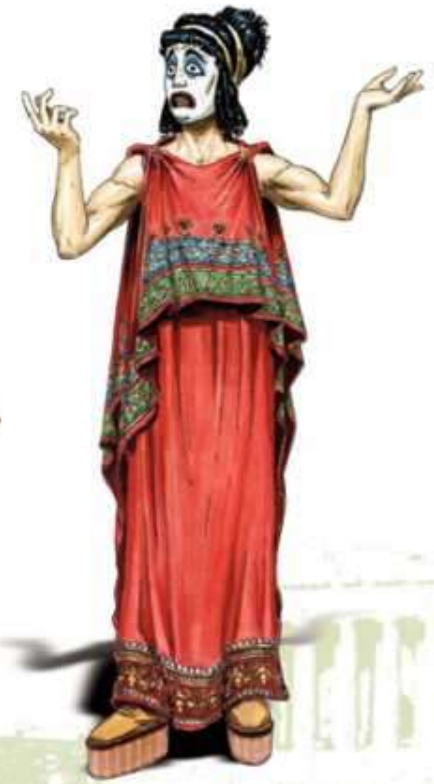
Aktor w kobiecej masce tragicznej